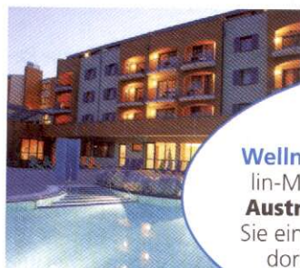
Das Austria Trend Life Resort Loipersdorf wartet auf Sie!

Wellness-Weekend zu gewinnen! Die Shaolin-Mönche residieren noch bis Ende 2010 im Austria Life Resort Loipersdorf . Wenn auch Sie ein Weekend für 2 Personen plus Treatment dort gewinnen wollen, melden Sie sich ab sofort an unter: www.madonna24.at